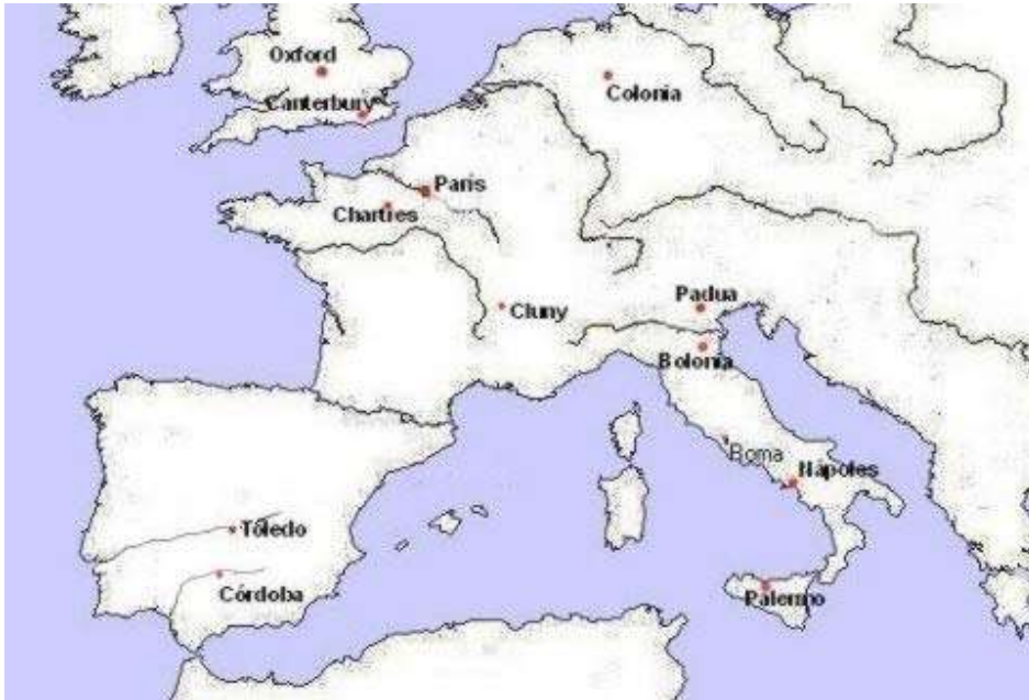
Centros de actividad y difusión de la filosofía medieval.